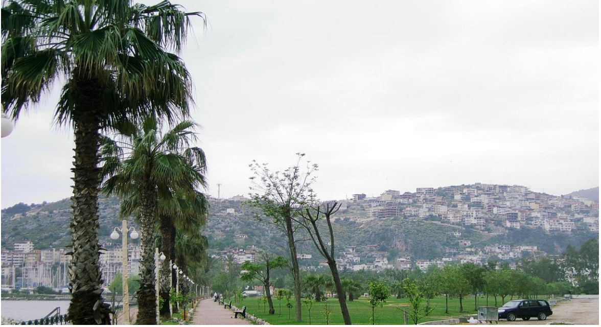
Çevre düzenleme-Yeşil alan